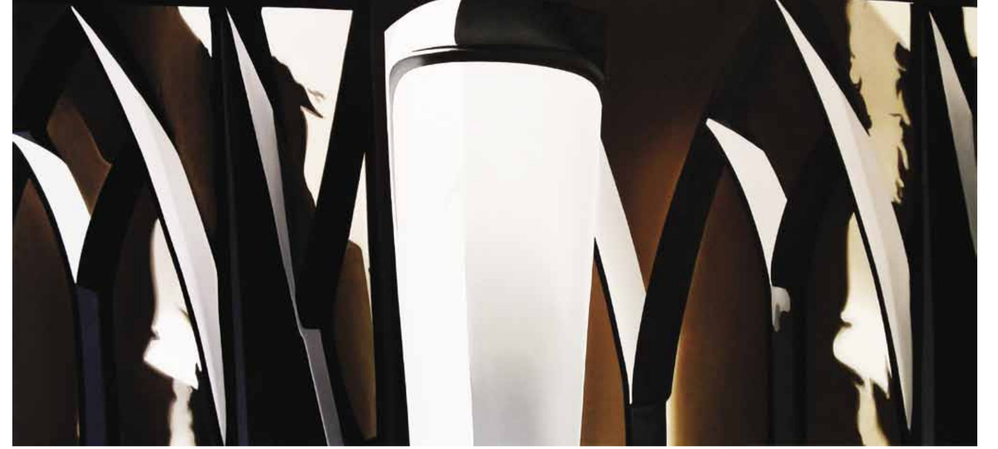
H. Avni Öztöpcü, Keskin Korunak, Tuval Üzeri Yağlı Boya, 92x107cm, 2011