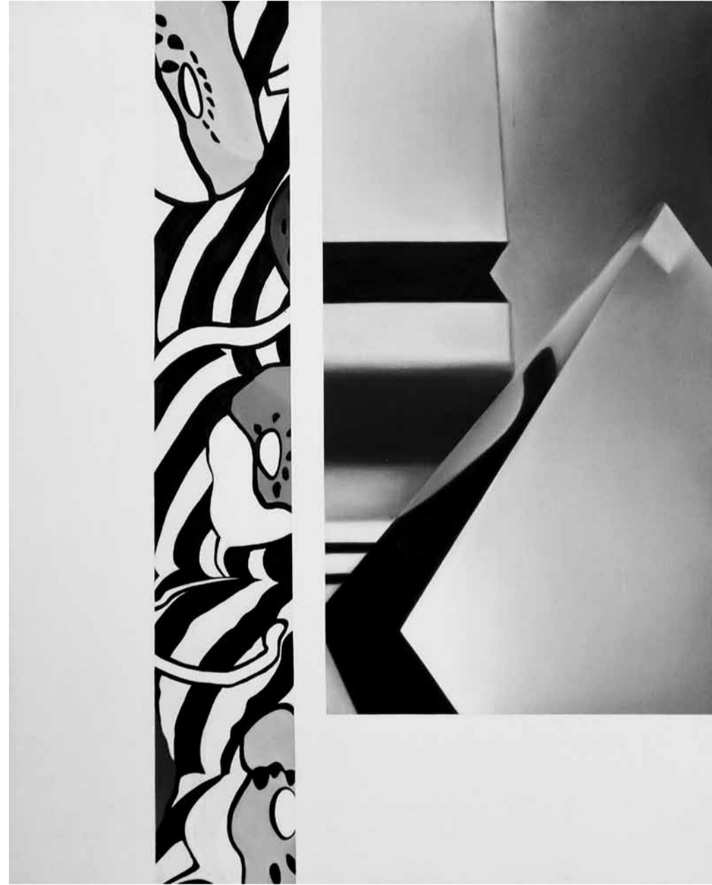
H. Avni Öztöpe, Çiçekli Sütun, Tuval Üzeri Yağlı Boya, 120x97cm, 1987